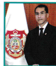
Magister Enver Vega Figueroa

Vega, E. (2019) "Geopolítica aplicada a las operaciones militares basadas en tecnologías de la información y comunicación". Pensamiento Conjunto . (Año 7, Número 2). p.p. 88-96.