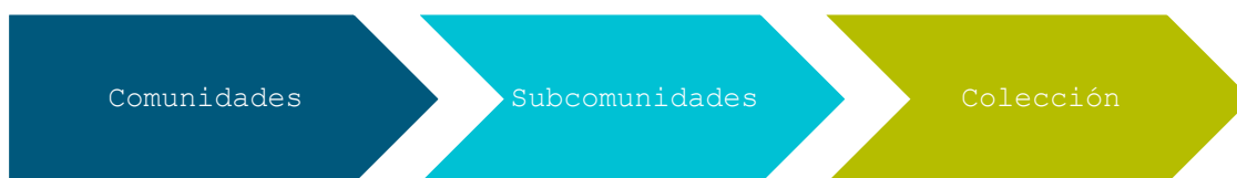
Gráfico N°03: Organización de los contenidos en un RI