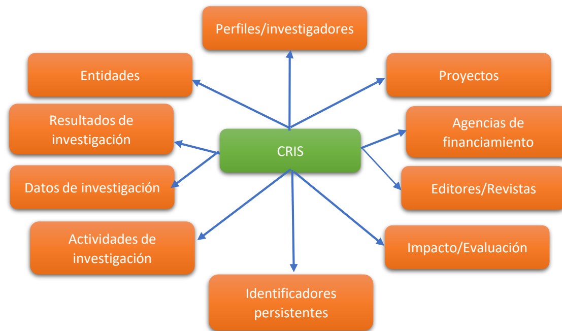
Figura: Tipos de datos en Dspace CRIS