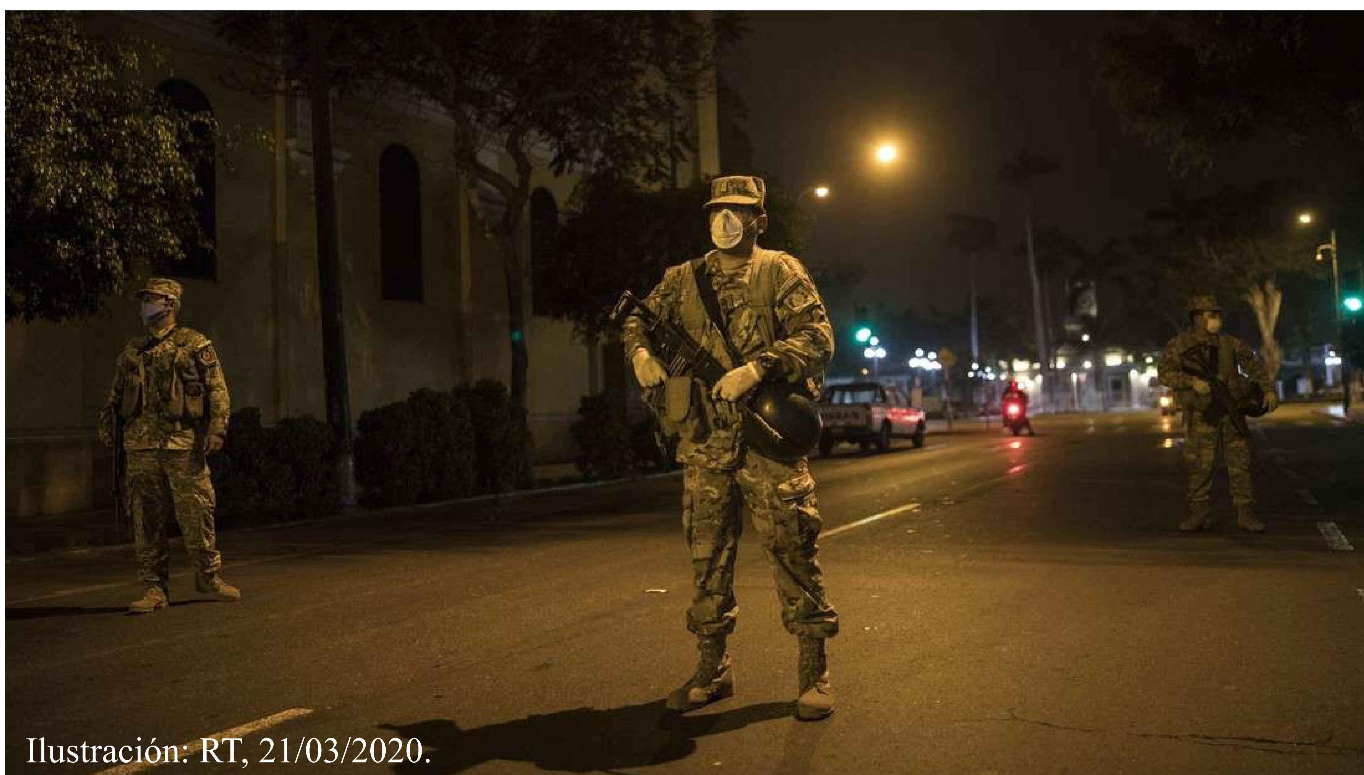
Ilustración: RT, 21/03/2020.

La cuestión central del funcionalismo se refiere al mantenimiento del orden social. Si se consigue el equilibrio y la integración funcional de la colectividad se tiene una salud social y vive la sociedad un estado normal. La sociedad vive un estado anormal cuando se produce una falta de regulación interfuncional de las partes con relación al todo; es decir, la sociedad tiene una enfermedad social (Ritzer, 1995b). ¿Las multas por incumplimiento de las disposiciones gubernamentales viabilizan el equilibrio y la integración funcional de la sociedad peruana, en el contexto de la pandemia de Covid-19? ¿La presencia de las fuerzas armadas y policía –controlando las calles y accesos a instalaciones de servicios básicos y de abastecimiento- son la parte del todo que producen la regulación interfuncional de la sociedad peruana frente a las medidas gubernamentales?