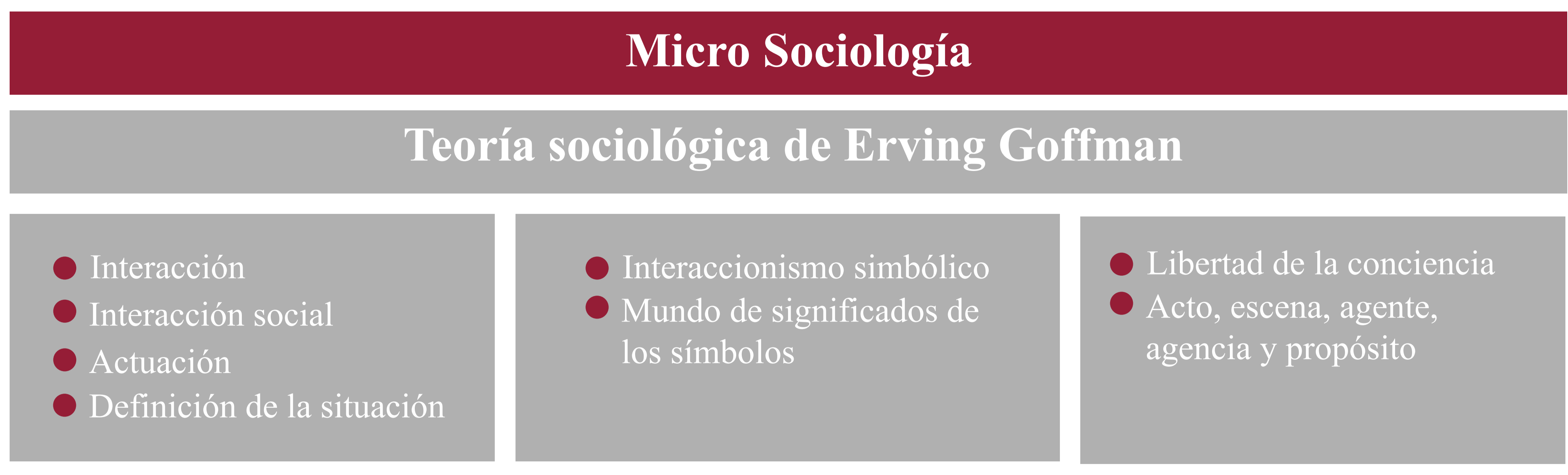
Figura 2. Estructura categorial de teorías micro-sociológica para la observación, el diálogo teórico-empírico, y el análisis y discusión. Elaboración propia.

Se utilizaron métodos fundamentalmente hermenéuticos-interpretativos propuestos por Vargas (2011):