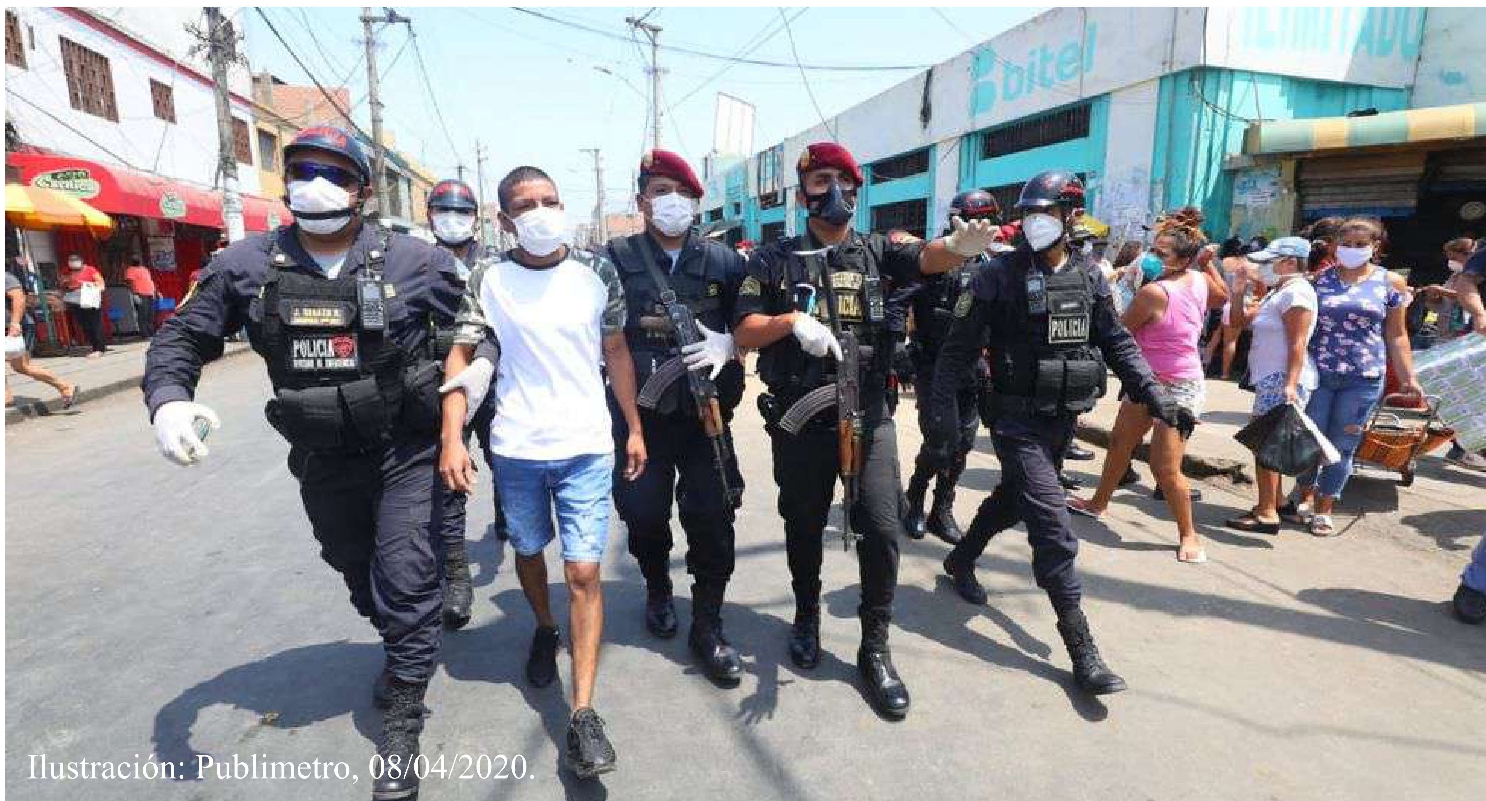
Ilustración: Publimetro, 08/04/2020.