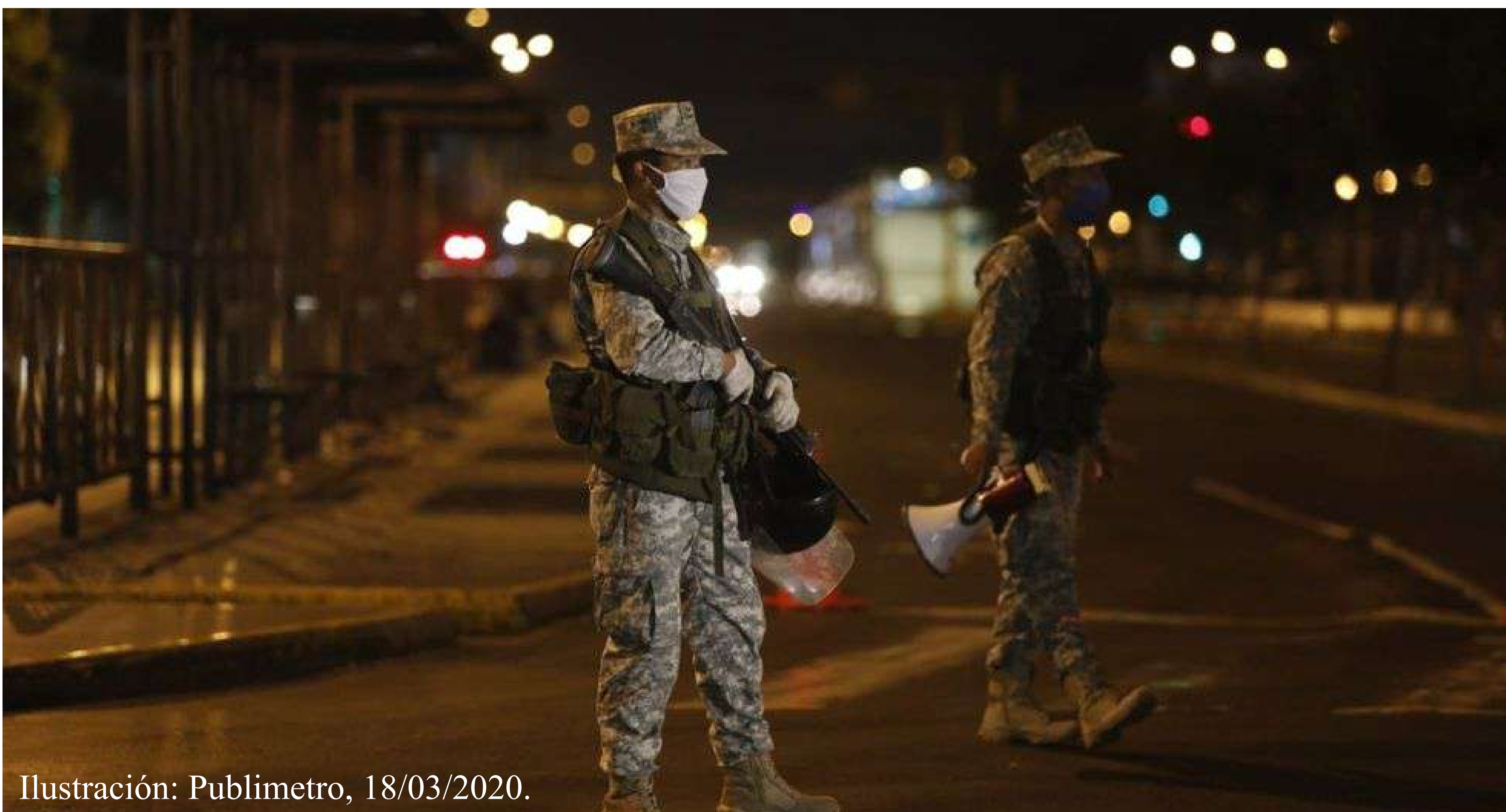
Ilustración: Publimetro, 18/03/2020.

El conjunto de medidas para el control social –tomando prestada esta categoría de Edward Ross (1901)- debían de ser cumplidas por la población; es decir, desde ese momento, además del confinamiento, los individuos debían de adecuar drásticamente su vida cotidiana y su comportamiento a las nuevas reglas de convivencia, de interacción humana, y de organización social y cultural. Y comenzó la respuesta social. Todo trasciende dentro de una crisis estructural en marcha.